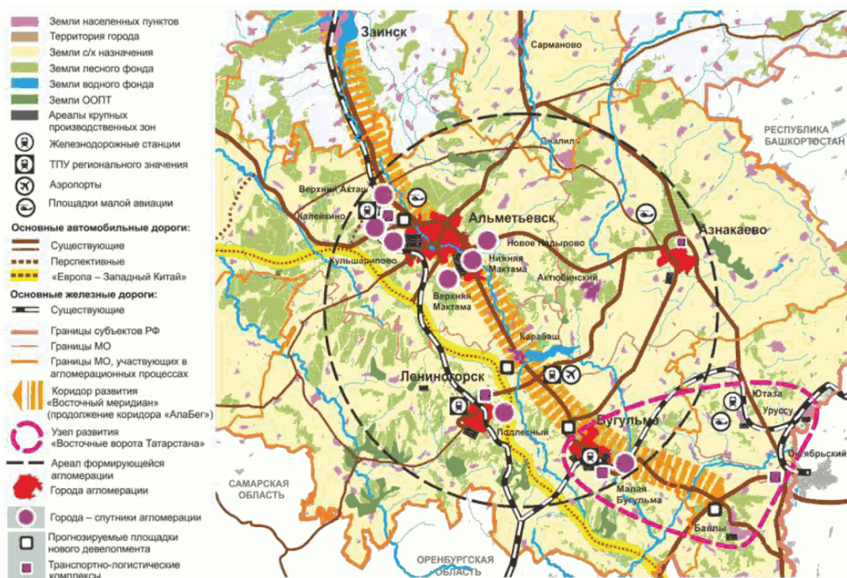
"Рис. 3.19. Пространственное развитие Альметьевской агломерации"

Планируемые к разработке и реализации программы: